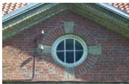
Bevaringsværdige bygningsdetaljer i Avedørelejren. Fra Designmanualen for Avedørelejren.