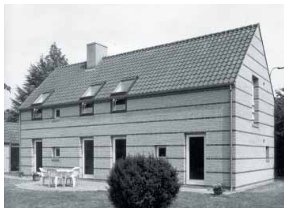
Enfamiliehus på Femagervej blev præmieret i 1992. Arkitekt: Chresten Christensen