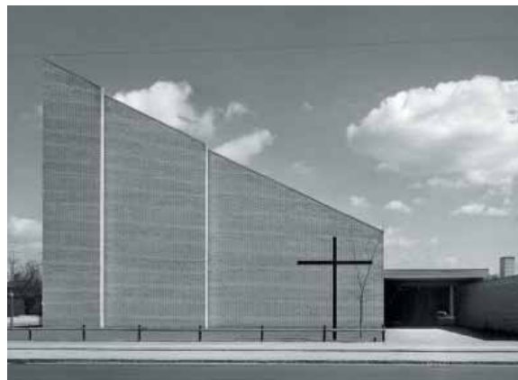
Sct. Nikolai Kirke på Strøbyvej blev præmieret i 1961. Arkitekt: J. O. von Spreckelsen.

Følgegruppen opfordrer til, at de registrerede bevaringsværdier i kommuneatlasset for såvel bymiljøer, bebyggelser som bygninger sikres både bevaring og fornyelse i den fremtidige kommune- og lokalplanlægning samt efterfølgende byggesagsbehandling. Der skal samtidig i planlægningen tages et særligt hensyn til de kulturhistoriske træk i kommunen.