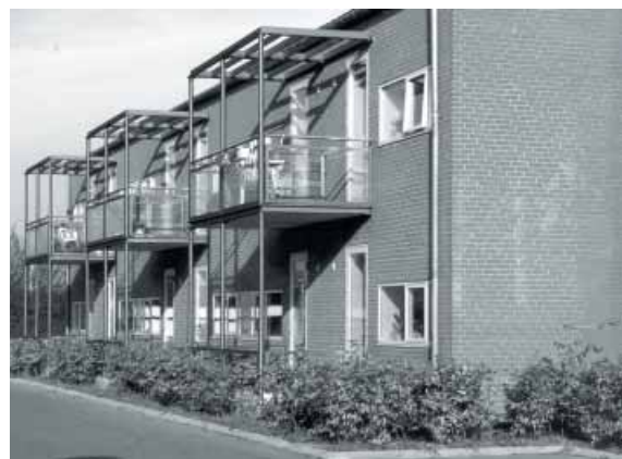
Ældreboliger på Krogstens Allé blev præmieret i 1999. Arkitekt: Frederiksen & Knudsen

Nedenfor er vist 3 eksempler på bygninger, som er blevet præmieret med diplom og indmuringsplade.