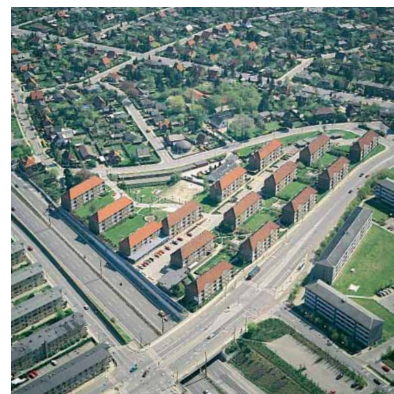
Luftfoto af Hvidovrevej ved Holbækmotorvejens gennemskæring.

Udbygningen af Hvidovre efter 1945 blev på mange måder et billede på samfundets skiftende kultur- og boligpolitiske udvikling, og kan i nogen grad opfattes som et spejlbillede af velfærdssamfundets opbygning. En høj standard i de sociale institutioner og gode sunde boliger til rimelige priser blev målet. Rækkehuse og etageboliger skød op. Bredalsparken opførtes i tiåret 1950-60 og blev hurtigt kendt som et vægtigt socialt og arkitektonisk vellykket projekt, og et eksempel på, at etageboligbyggeriet blev eftertragtet i det nye velfærdssamfund, der i disse år var under hastig udvikling.